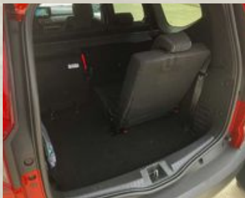
► Sjusitsig fullhybrid. Dacia Jogger har få riktiga konkurrenter i Sverige så valet står troligen mellan Jogger och Jogger.