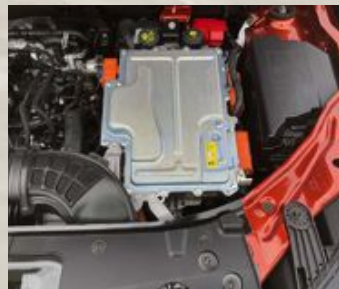
► Dubbla elmotorer där en startar bilen och den andra kan driva den framåt betyder rakt igenom lägre förbrukning.

När syskonbilen Duster kommer i sina nästa generation och börjar byggas på samma plattform som Jogger är hybriddrivlinan troligen med redan vid lanseringen. Det är mer tveksamt om den mindre modellen Sandero också får hybridmotorn. På en så lätt och liten bil ger hybriddrivlinan inte samma effekt på utsläppssiffran och kanske vill de som köper en Sandero inte lägga de extra pengar som krävs för att få en hybrid. Prispåslaget för Hybrid 140 i Sverige är 100 000 kronor. Men då får du förstås också automatlådan.