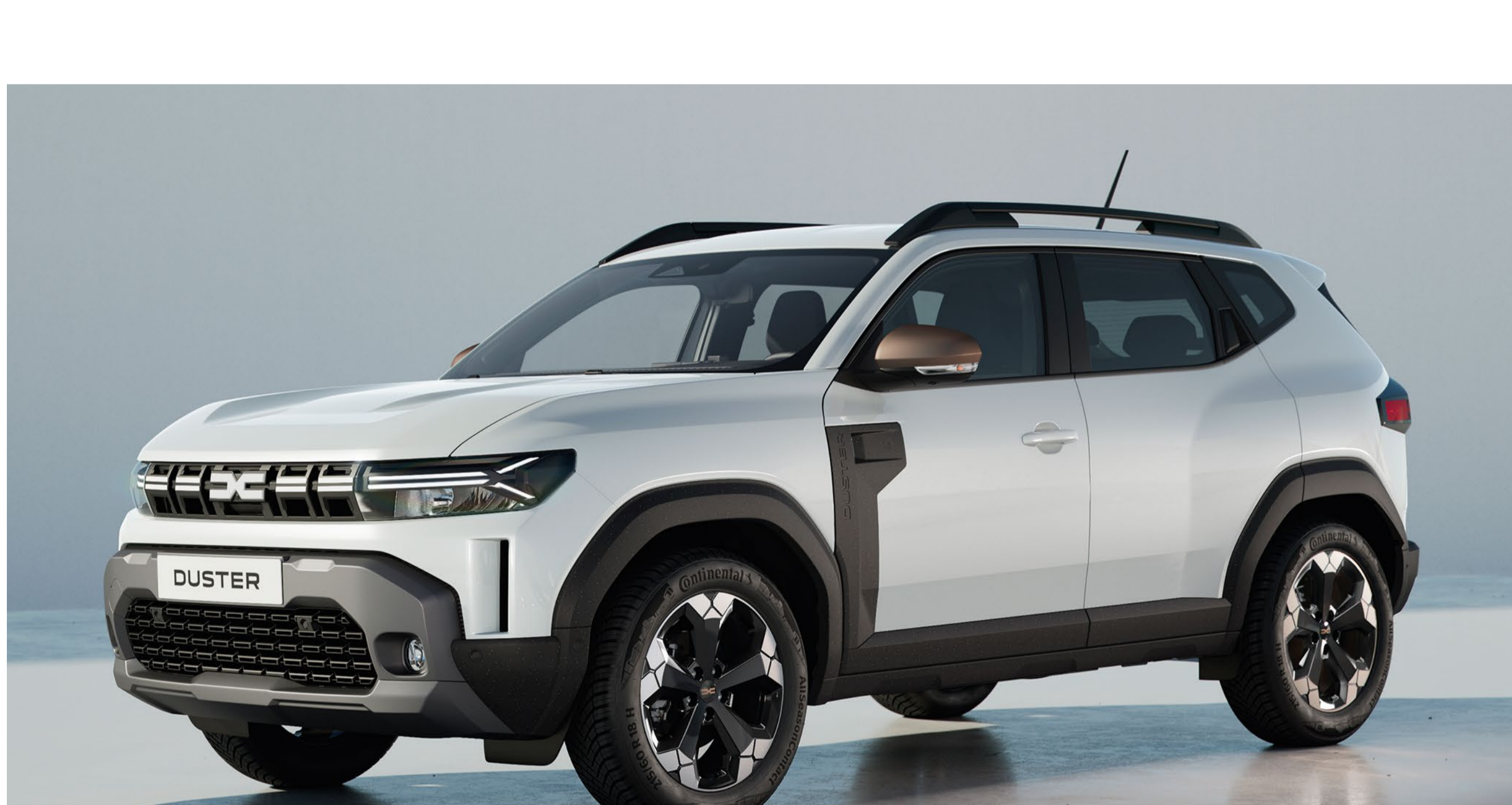
GLACIER VIT (2)