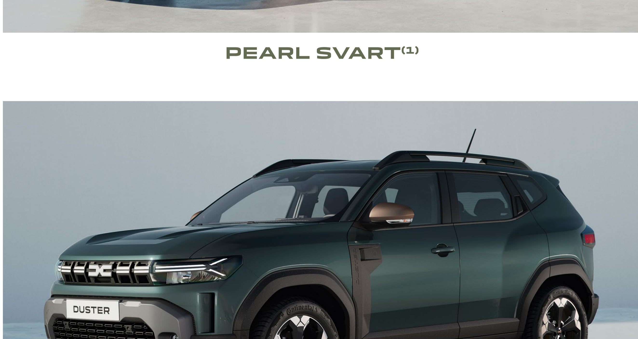
CEDAR GRÖN (1)