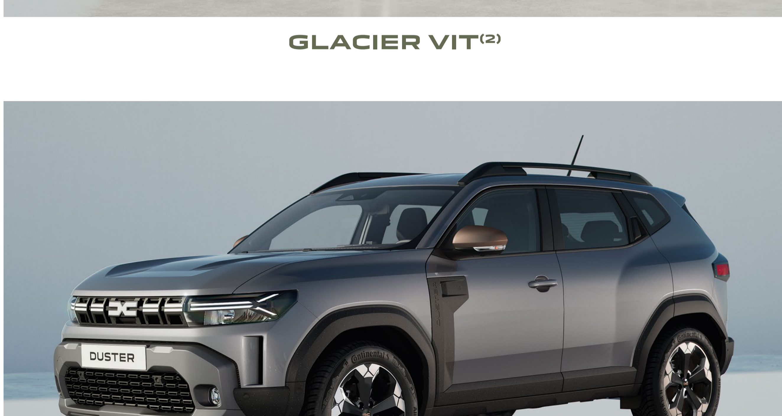
SCHISTE GRÅ (1)