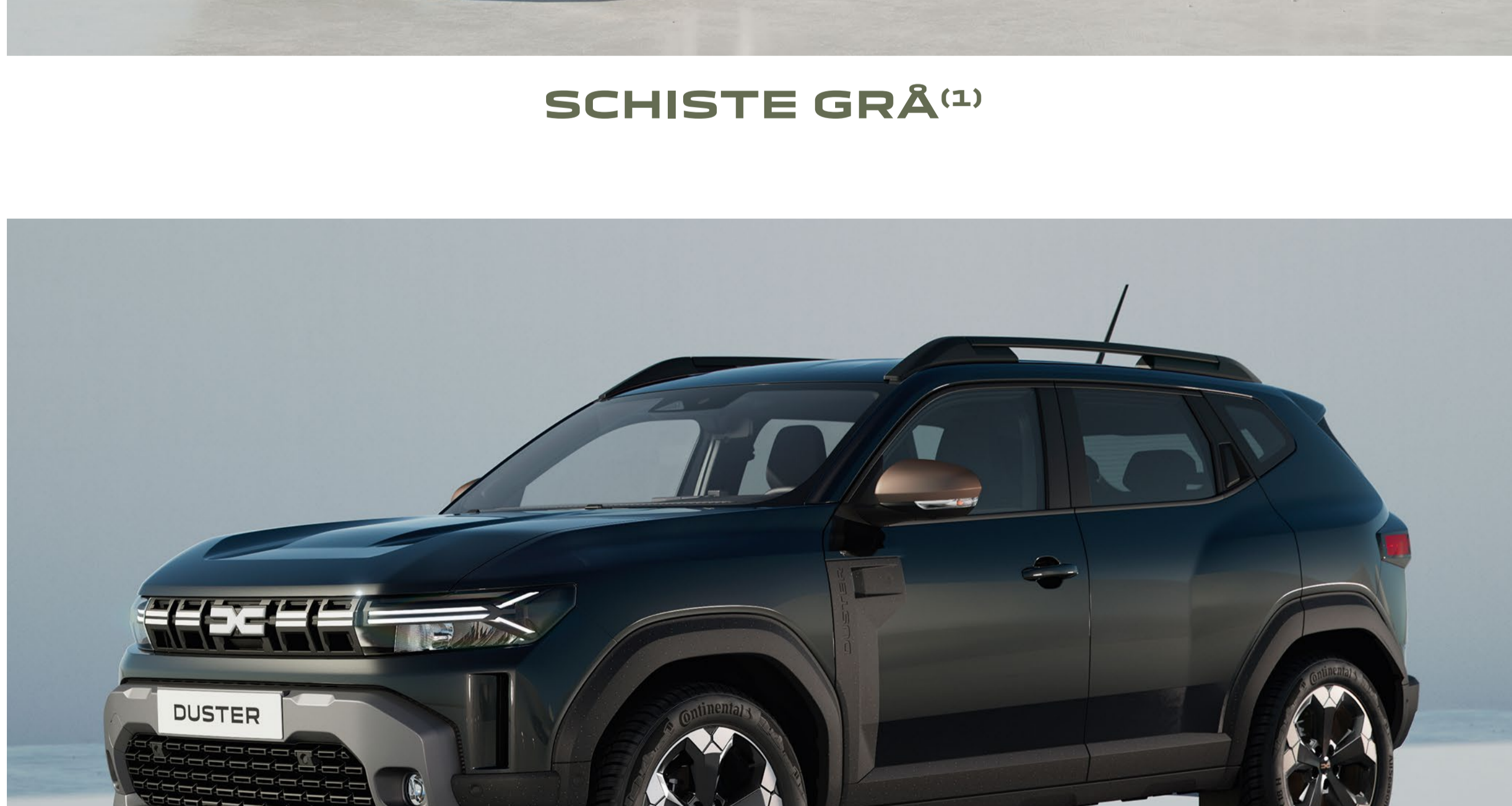
PEARL SVART (1)