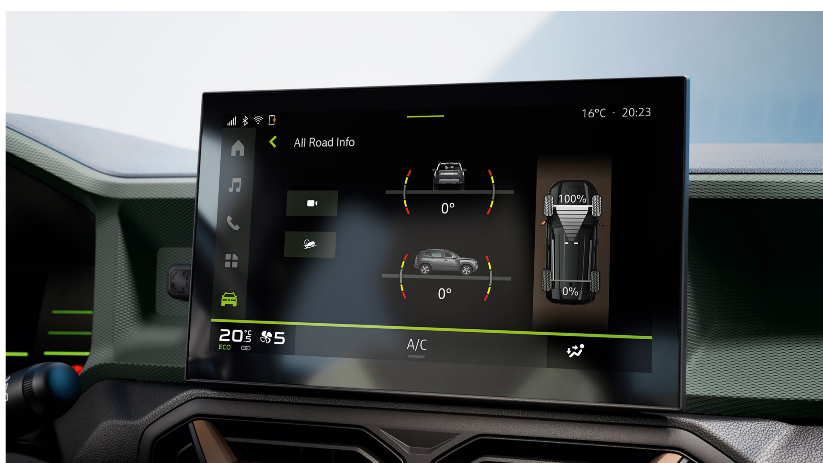
Pekskärm med höjdmätare

I 4x4-utförande tar sig Helt nya Duster bekymmersfritt fram på alla slags vägar. Välj bara körprogram efter underlag, så bär det av. Upp till 217 mm markfrigång och en angreppsvinkel på 31° - perfekt för att klättra uppför utmanande branter. Paneler i Starkle ® , ett nytt delvis återvunnet material, skyddar karossen och gör eventuella repor mindre synliga. Helt nya Duster tål att användas, alltid trogen sitt SUV-DNA.